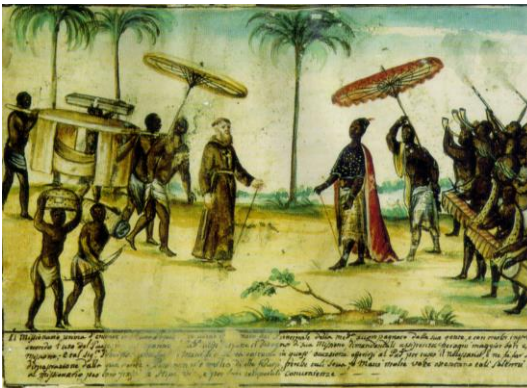
Missionário Capuchinho sendo recebido pelo príncipe do Sogno, reino do Congo (c. 1740)

9. Como foram recebidos os Europeus na costa ocidental de África? Atenta na imagem.