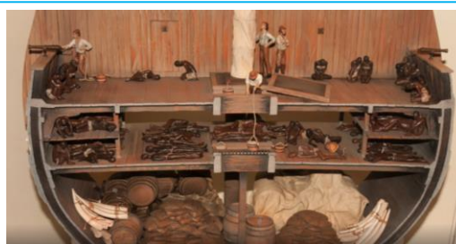
Interior de um navio negreiro (maquete)