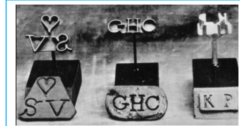
Ferros usados para marcar os escravos com o símbolo do seu dono