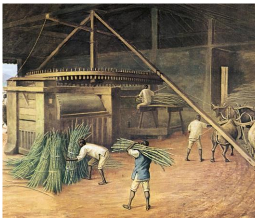
Moagem da Cana na Fazenda Cachoeira, em Campinas, s.d.

(Benedito Calixto/ Museu Paulista da Universidade de São Paulo)