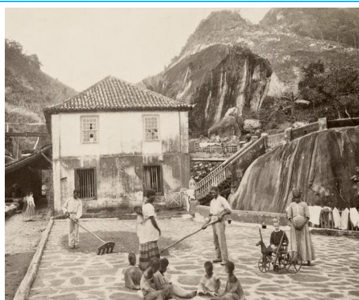
Fazenda Quititi, Rio de Janeiro, 1865

(Benedito Calixto/ Museu Paulista da Universidade de São Paulo)