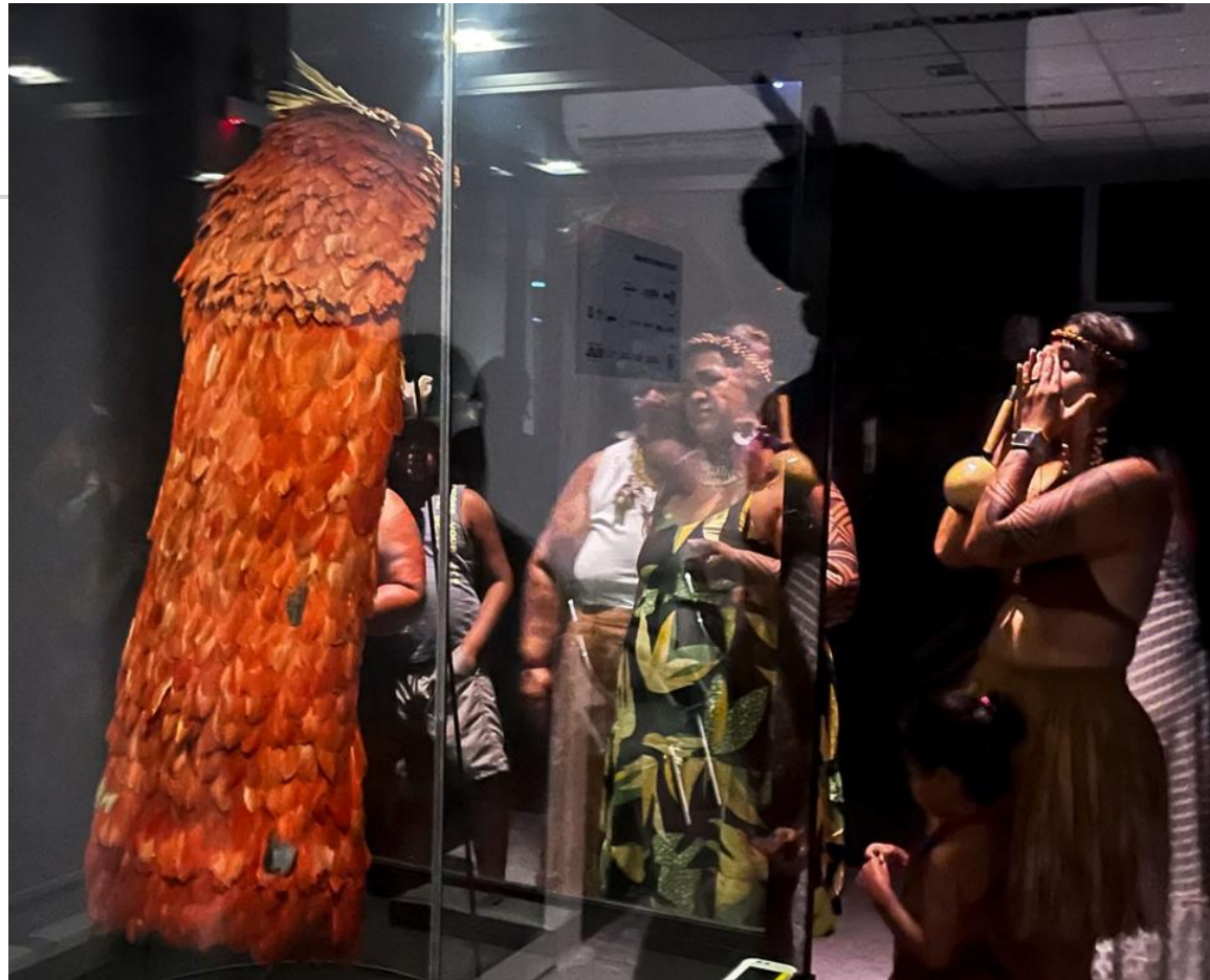
Cerimônia oficial de retorno do manto Tupinambá. Museu Nacional, RJ, Brasil, 2024