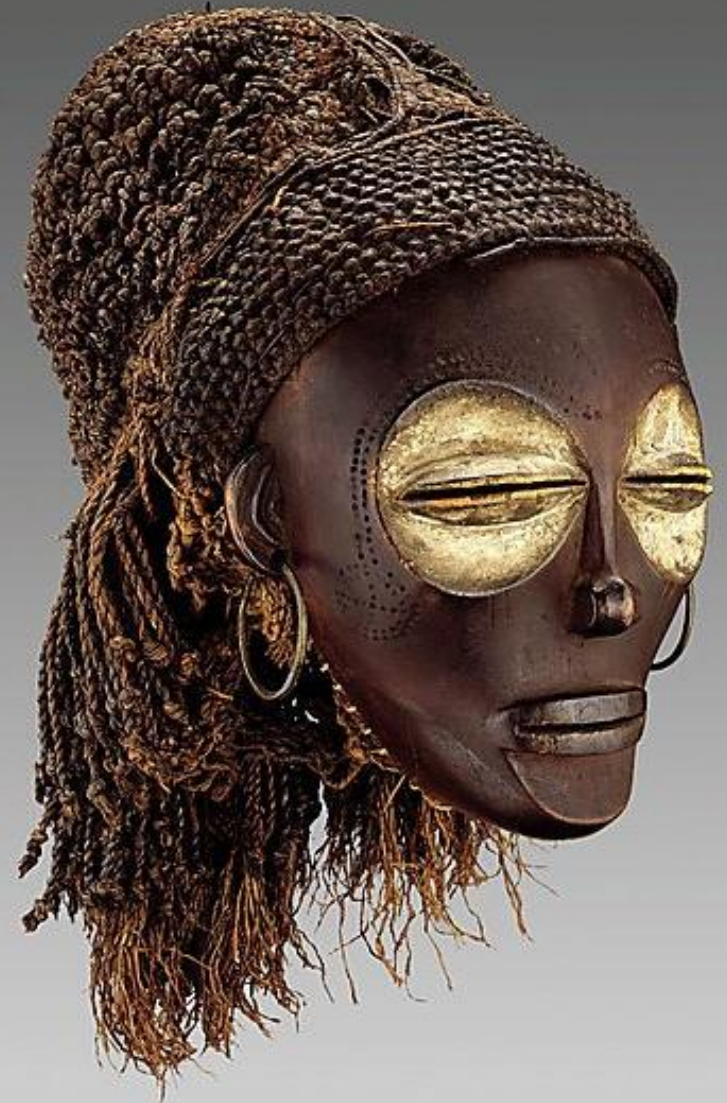
"Máscara Pwo". Origen: Angola, África. Metropolitan Museum of Art