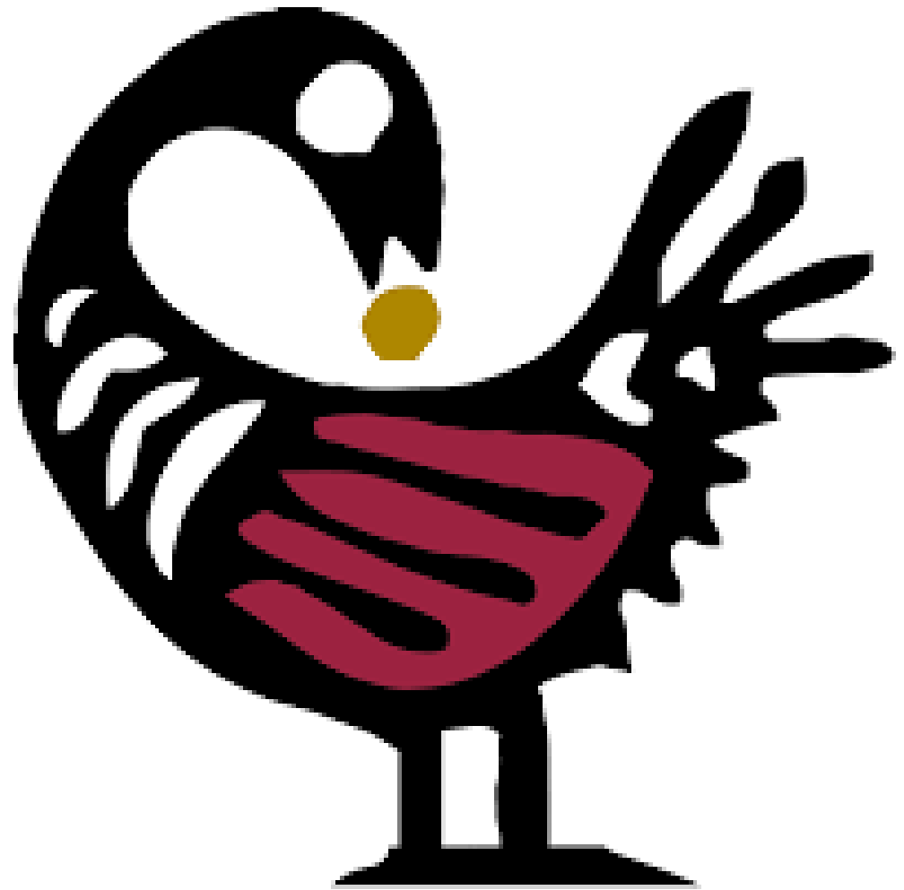
Símbolo Adinkra para sankofa