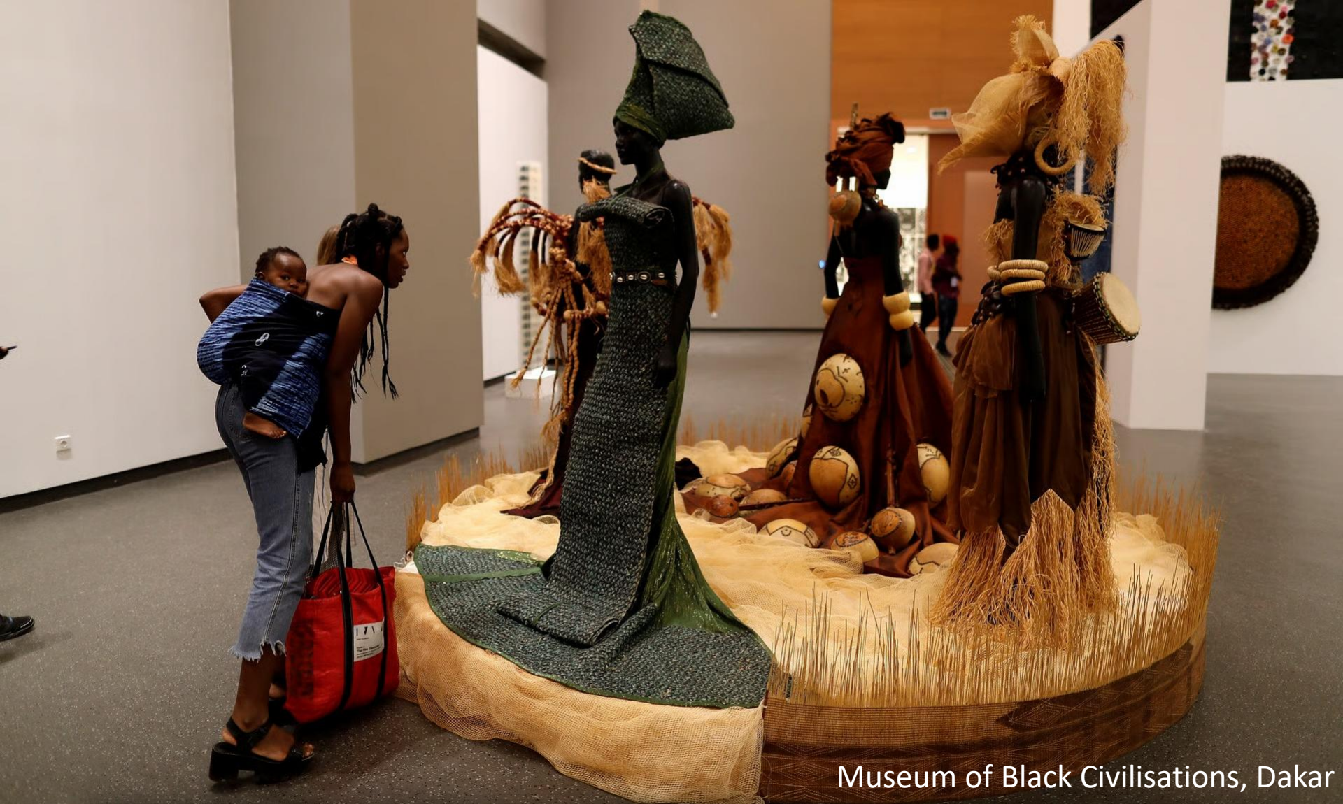
Museum of Black Civilisations, Dakar

Decolonizar é transformer: Conhecimento Representação Autoridade Participação (...)