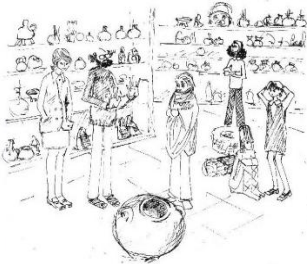
DISCUSION EN LA BODEGA DE ARQUEOLOGIA POR LA SELECCION DE MATERIAL

ORDOÑEZ GARCÍA, Coral. The Casa del Museo, Mexico City: an experiment in bringing the museum to the people. Museum , v. XXVII, n. 2, p. 71-77, 1975.