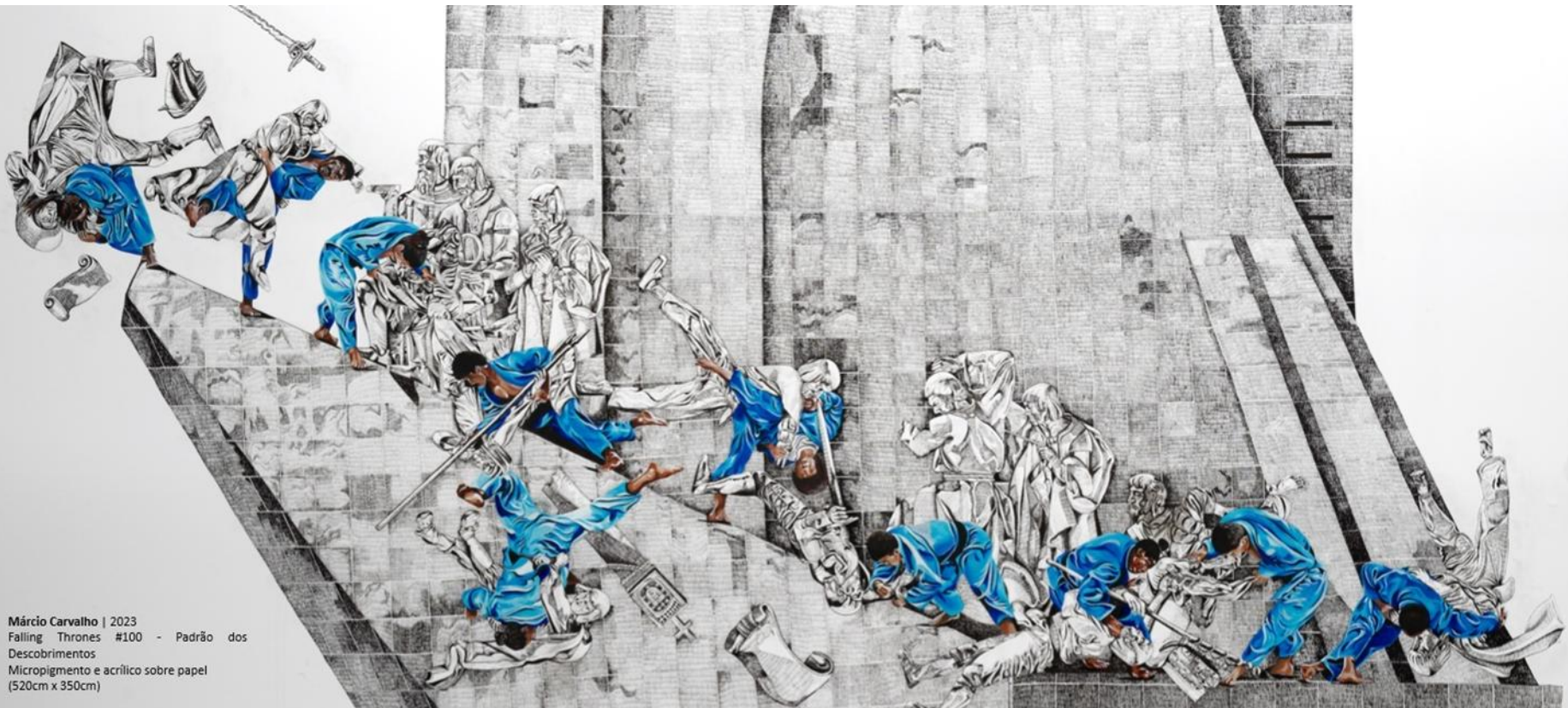
Márcio Carvalho | 2023 Falling Thrones #100 - Padrão dos Descobrimentos Micropigmento e acrílico sobre papel (520cm x 350cm)