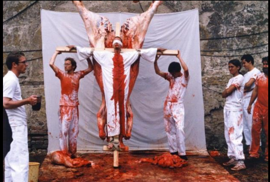
Orgies Mysteries Theater – 1962-98

Como é tratado o corpo pelos grupos de Viena?