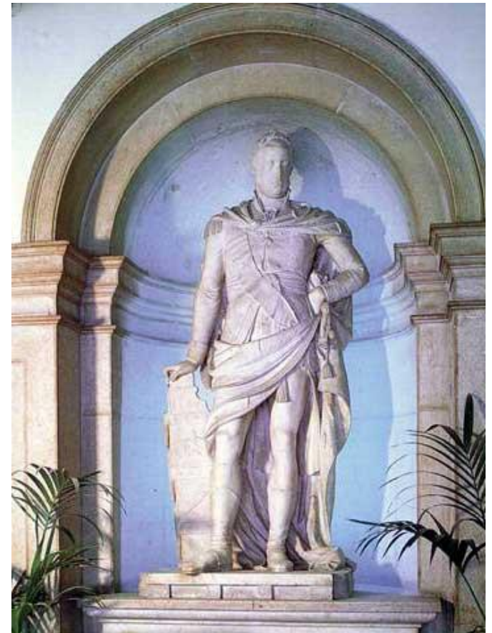
1823, Hospital da Marinha, Lisboa