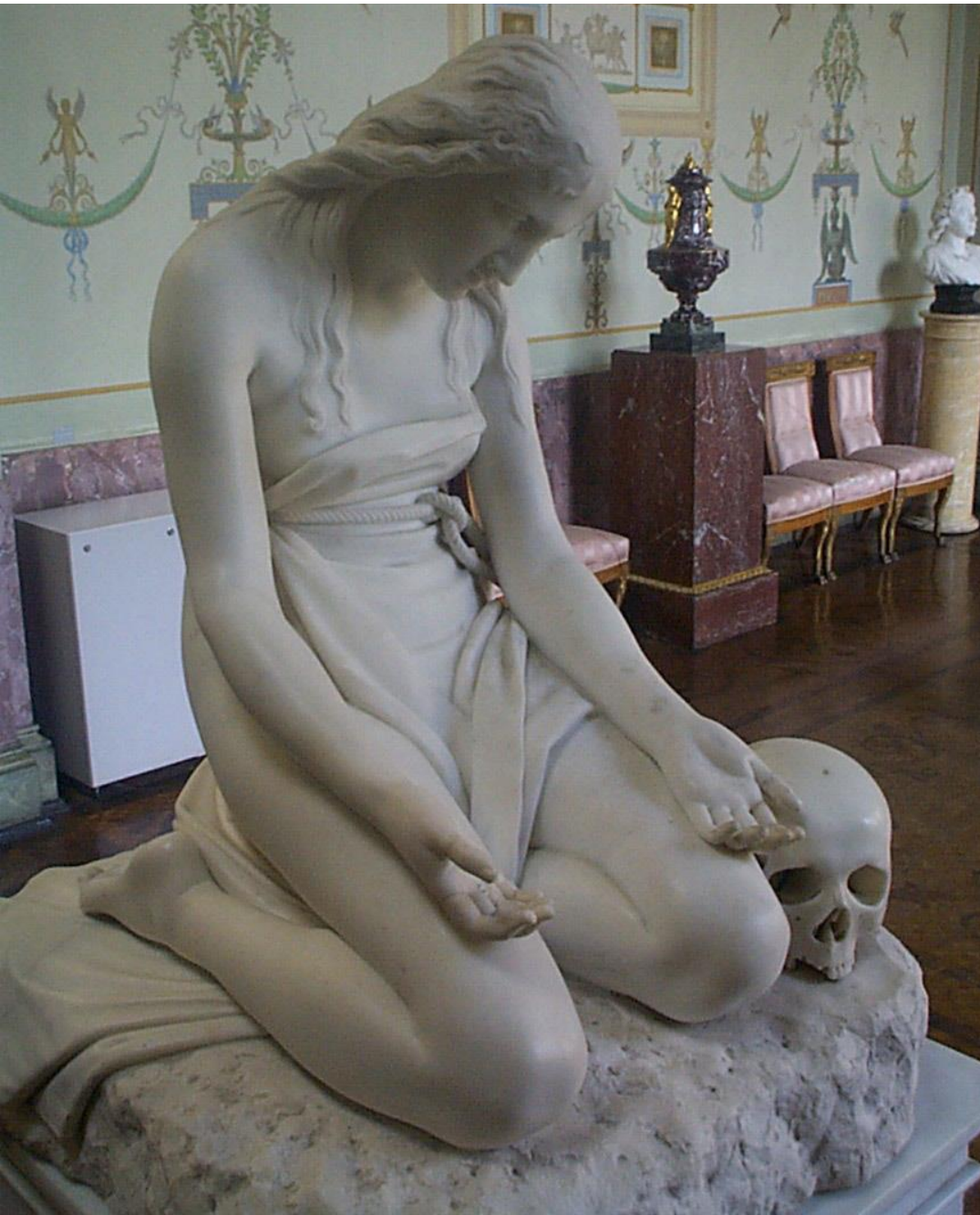
Antonio Canova (1757-1822), Madalena Arrependida , 1809, Museu Hermitage, S. Petersburgo