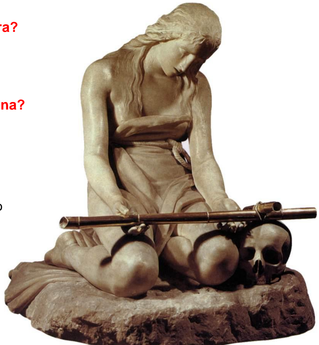
Antonio Canova (1757-1822), Madalena Arrependida , 1796, mármore, alt. 94 cm, Palácio Bianco, Genova