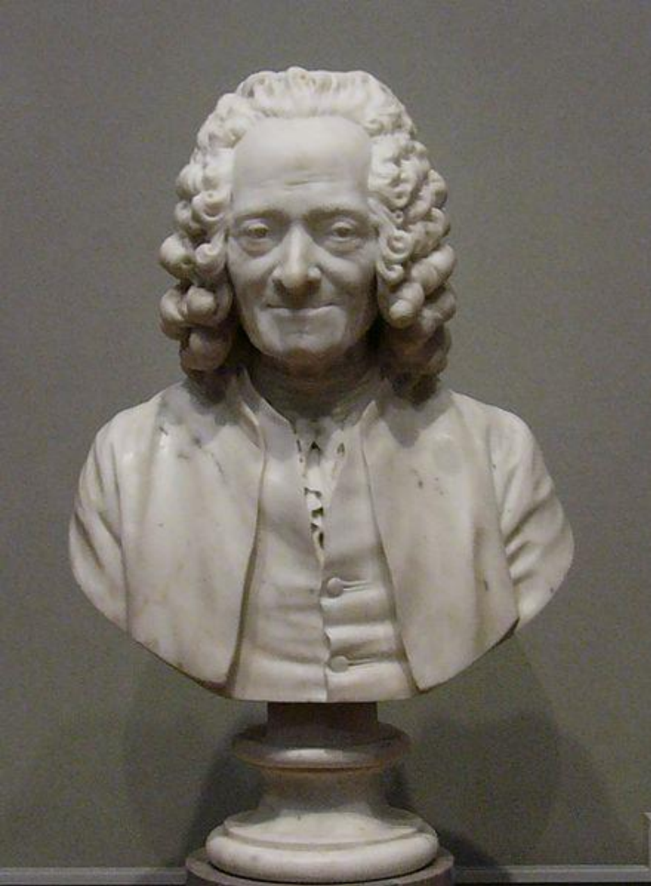
Jean-Antoine Houdon Busto de Voltaire com peruca , mármore, alt, 52,7 cm, Galeria Nacional de Arte, Washington

Qual é a temática? Busto de glorificação