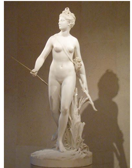
Diana , 1780, mármore, alt 210 cm, Museu Calouste Gulbenkian, Lisboa

Consegues ver estas características nesta obra?