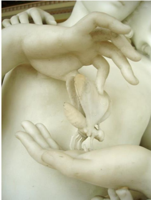
Antonio Canova, Cupido e Psiché , 1808, Hermitage, S. Petersburgo

Porquê a borboleta? Psyché em grego é borboleta simboliza a imortalidade da alma e a felicidade