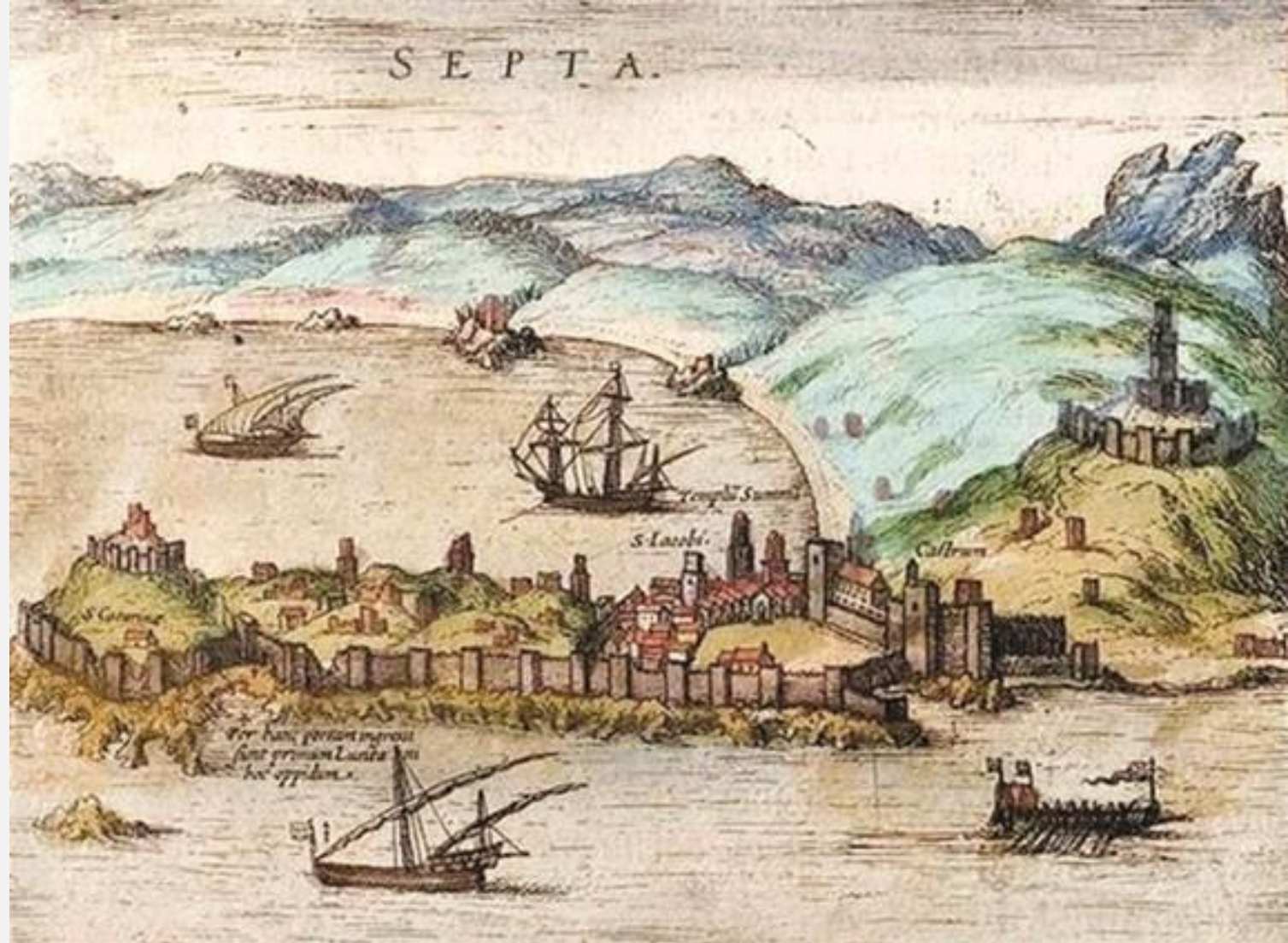
Ceuta, In, Civitates orbis terrarum (século XVI / XVII)

Ceuta era essencial para os navios cristãos que circulavam no Mediterrâneo proporcionando um porto seguro em caso de perigo.