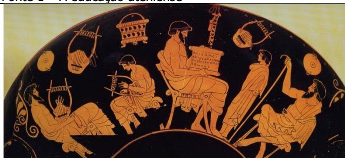
Cena em vaso grego, séc. V a. C.