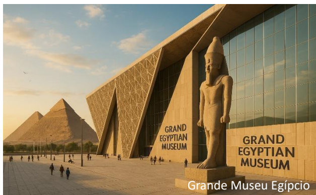
Grande Museu Egípcio