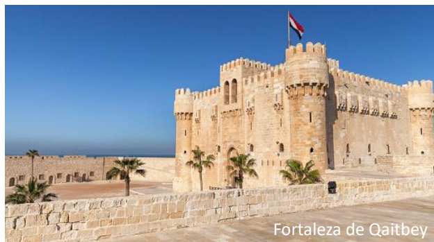
Fortaleza de Qaitbey