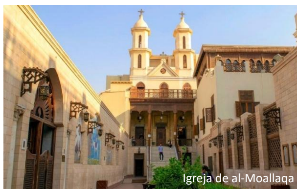
Igreja de al-Moallaqa