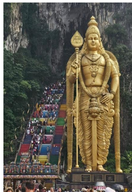
Grutas de Batu

Após o pequeno-almoço no hotel, visitaremos o Museu Nacional , projectado de acordo com as características de um palácio malaio Minangkabau Gadang. Almoço em restaurante local. De tarde, conheceremos as famosas Torres Petronas e a Ponte Suspensa que liga as duas torres, as quais oferecem vistas espectaculares de 360 graus sobre Kuala Lumpur. Antes do final do dia, ainda visitaremos a Mesquita Jamek , uma das mesquitas mais antigas de Kuala Lumpur, construída em 1909 e localizada na confluência dos rios Klang e Gombak, apresentando uma elegante arquitetura de inspiração mourisca. Jantar em restaurante local. Regresso ao hotel e alojamento.