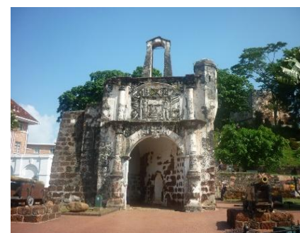
Porta de Santiago