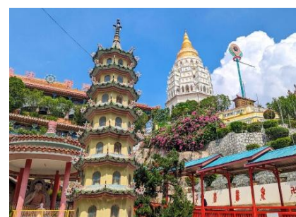
Templo Kek Lok Si