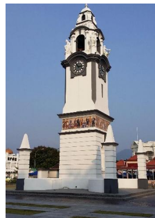
Torre do Relógio Memorial Birch

Pequeno-almoço (no hotel ou breakfast-box, dependendo da hora do voo). Em hora a determinar, transporte para o aeroporto e partida com destino a Singapura. Chegada a Singapura, formalidades de desembarque, transporte para o centro e almoço em restaurante local. Início da visita desta cidade-estado , uma mostra do contraste entre o antigo e o moderno. Durante a tarde iremos explorar a nova zona de Gardens by the Bay , onde visitaremos a fantástica “ Flower Dome ”, a maior estufa de vidro do mundo, listada no Guinness World Records em 2015; a “ Cloud Forest ” (visita sujeita ao fecho das cúpulas), que nos oferece uma vegetação diversificada, tendo também a oportunidade de aprender sobre plantas raras. Seguiremos pelo passadiço de “ OCBC Skyway ”, que nos permitirá desfrutar de vistas panorâmicas dos jardins e de Marina Bay e onde iremos admirar um espectáculo de luz e som . Jantar em restaurante local. Alojamento no Hotel Grand Copthorne Waterfront 5* .