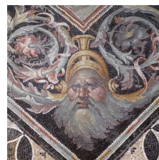
Museu de Sétif