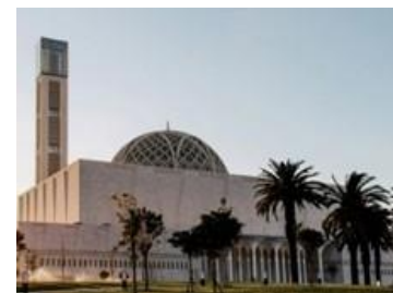
Mesquita Djamaa el Djazair/ Argel

Após o pequeno-almoço no hotel, transporte para o aeroporto. Formalidades de embarque e partida para Lisboa, em voo regular Iberia, com partida de Argel às 08h35 (escala em Madrid das 11h10 às 15h40). Chegada ao aeroporto de Lisboa pelas 16h05.