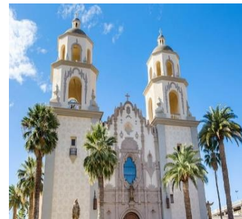
Basílica Sto. Agostinho / Annaba

Após o pequeno-almoço, partida para a bela e intocada costa oeste da Argélia para visitar as cidades costeiras de Tipaza e Cherchell . Esta última, antiga capital de Juba II e Cleópatra, localiza-se a cerca de 80km da antiga Cesareia, que no século IV a.C. fazia parte do império marítimo fenício. Tornou-se parte da Numídia durante o reinado de Jugurta, que morreu em 104 a.C. Com a chegada dos romanos, ela recebeu o nome de Cesareia e depois tornou-se a capital do reino da Mauritânia e um dos aliados mais importantes e leais do Império Romano. No final do século IV d.C., os Vândalos incendiaram a cidade, mas às ordens do imperador bizantino Justiniano (séc. VI d.C.), a cidade foi reconquistada, reconstruída e devolvida ao seu antigo esplendor. No centro da cidade, situa-se o museu que abriga belas esculturas gregas e romanas do Norte de África. Após o almoço , viagem para Tipaza , cidade que combina uma interessante mistura de ruínas fenícias, romanas, bizantinas e paleocristãs. Tipaza foi construída em três pequenas colinas e a maioria das casas fica na colina central. Aqui encontram-se vestígios de três igrejas: a Basílica Grande , a Basílica de Alexandre e a Basílica de Santa Salsa , as quais são rodeadas por dois cemitérios repletos de caixões feitos de pedra e revestidos com