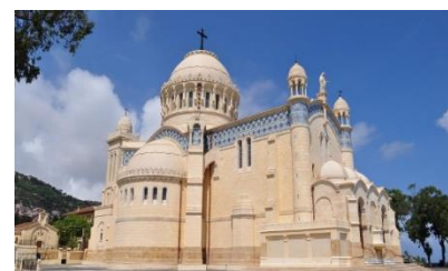
Notre Dam D'Afrique