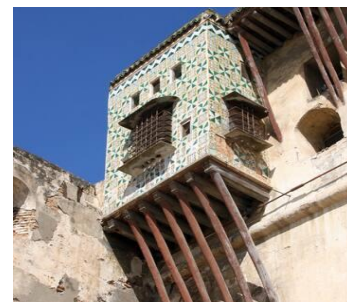
Kasbah / Constantine