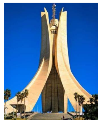
Monumento dos Mártires

Bem cedo, partida para o aeroporto de Ghardaia para voo com destino a Annaba, via Argel (horários previstos 08h15/09h45+11h20/12h35). Ao chegar a Annaba, transporte para restaurante local para almoço . A tarde é dedicada à descoberta das fascinantes ruínas romanas de Hippo Regius , que incluem um teatro bem preservado, termas e vestígios de uma basílica.