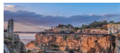
Ponte / Constantine