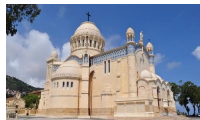
Notre Dame D'Afrique