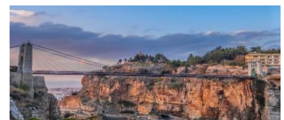
Ponte / Constantine