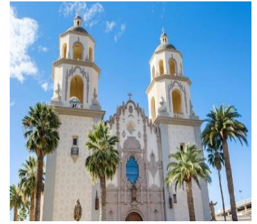
Basílica Sto. Agostinho / Annaba

Após o pequeno-almoço, partida para a bela e intocada costa oeste da Argélia para visitar as cidades costeiras de Tipaza e Cherchell . Esta última, antiga capital de Juba II e Cleópatra, localiza-se a cerca de 80km da antiga Cesareia, que no século IV a.C. fazia parte do império marítimo fenício. Tornou-se parte da Numídia durante o reinado de Jugurta, que morreu em 104 a.C. Com a chegada dos romanos, ela recebeu o nome de Cesareia e depois tornou-se a capital do reino da Mauritânia e um dos aliados mais importantes e leais do Império Romano. No final do século IV d.C., os Vândalos incendiaram a cidade, mas às ordens do imperador bizantino Justiniano (séc. VI d.C.), a cidade foi reconquistada, reconstruída e devolvida ao seu antigo esplendor. No centro da cidade, situa-se o museu que abriga belas esculturas gregas e romanas do Norte de África. Após o almoço , viagem para Tipaza , cidade que combina uma interessante mistura de ruínas fenícias, romanas, bizantinas e paleocristãs. Tipaza foi construída em três pequenas colinas e a maioria das casas fica na colina central. Aqui encontram-se vestígios de três igrejas: a Basílica Grande , a Basílica de Alexandre e a Basílica de Santa Salsa ,