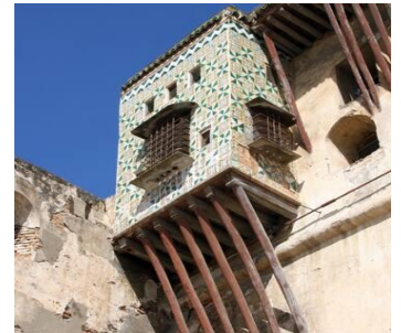
Kasbah / Constantine