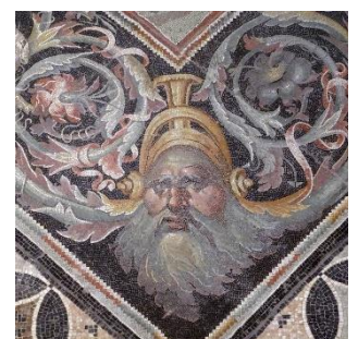
Museu de Sétif