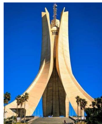
Monumento dos Mártires

Bem cedo, partida para o aeroporto de Ghardaia para voo com destino a Annaba, via Argel (horários previstos 08h15/09h45+11h20/12h35). Ao chegar a Annaba, transporte para restaurante local para almoço . A tarde é dedicada à descoberta das fascinantes ruínas romanas