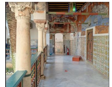
Palácio Bey / Constantine